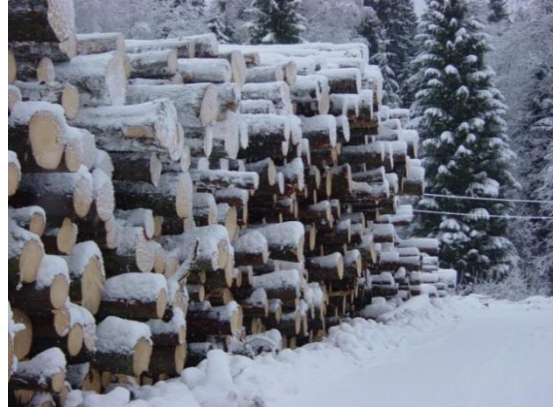
Mye skogsdrift gir stort ansvar for skogkultur

Har du som skogeier noen aktuelle felter for ungskogpleie? Det vil bli gitt økt tilskudd til ungskogpleie til skogeiere som benytter seg av JOB:U-prosjektet. Kontakt RKL.