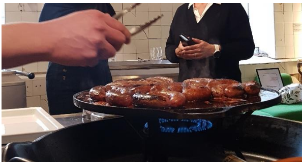
Mat med mening fra Indre Oslo Matforedling

Landbrukskontoret gratulerte så med diktsitat av Børli: Treet som vekser opp-ned .