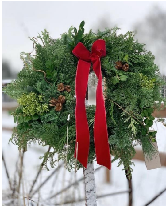
Dørkrans fra Marka Blomster i UKL Sørkedalen

Marka Blomster startet i år med et utprøvningsprosjekt om produksjon av snittblomster og dørkranser på Brenna gård i UKL-Sørkedalen.