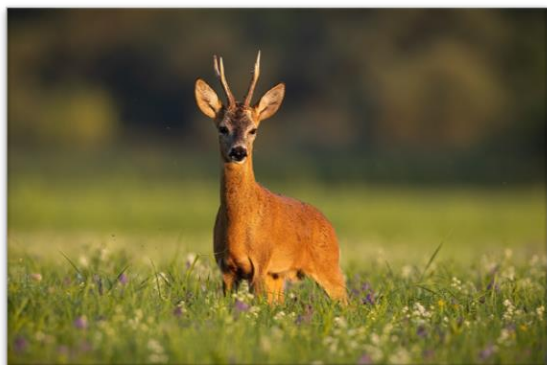
Bilde av rådyr.

vedtatt i kommunestyremøtet og gjelder for perioden 2022 – 2025.