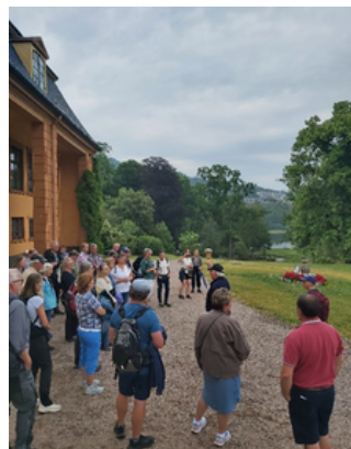
Bogstad gård, godset, er en viktig del av UKL-Sørkedalen