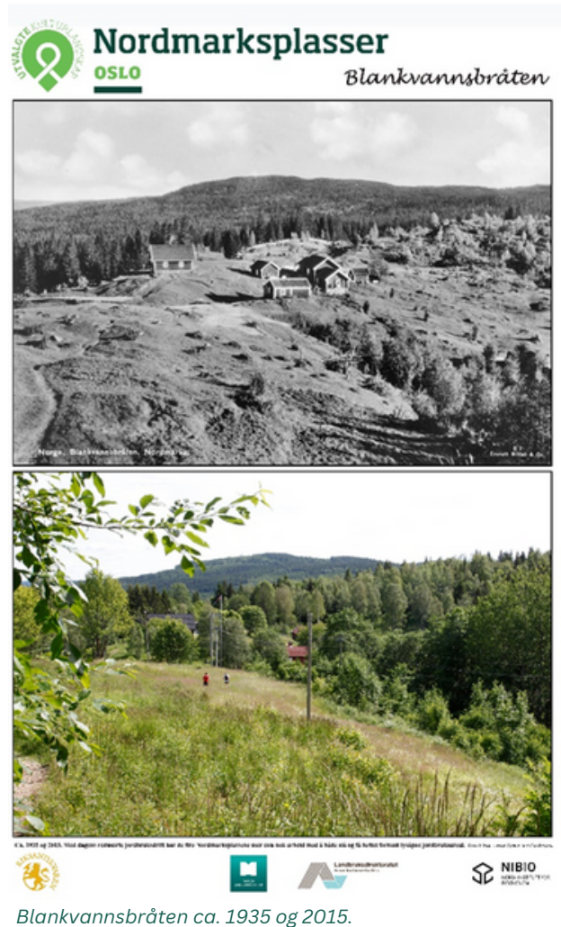
Blankvannsbråten ca. 1935 og 2015.

Med turen gjennom Nordmarksplassene andre dag ble det delt mye kunnskap av blant annet Kristina Bjureke ved UiO, og av grunneiere og driftere om skjøtsel av slåtteenger, økologiske miljø for planter. Det ble samtalt om at friluftslivet kan være en trussel mot skjøtsel av blomsterenger. De arkeologiske undersøkelsene på Finnerud om finnefolket og historiene til plassene ga utgangspunkt for lange trekk i kulturutviklingen i landskapet.