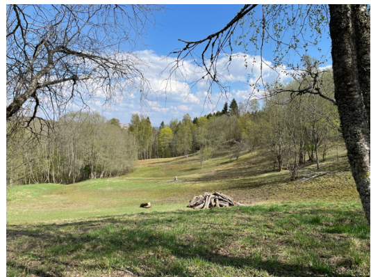
Hestejordene i midten av mai.