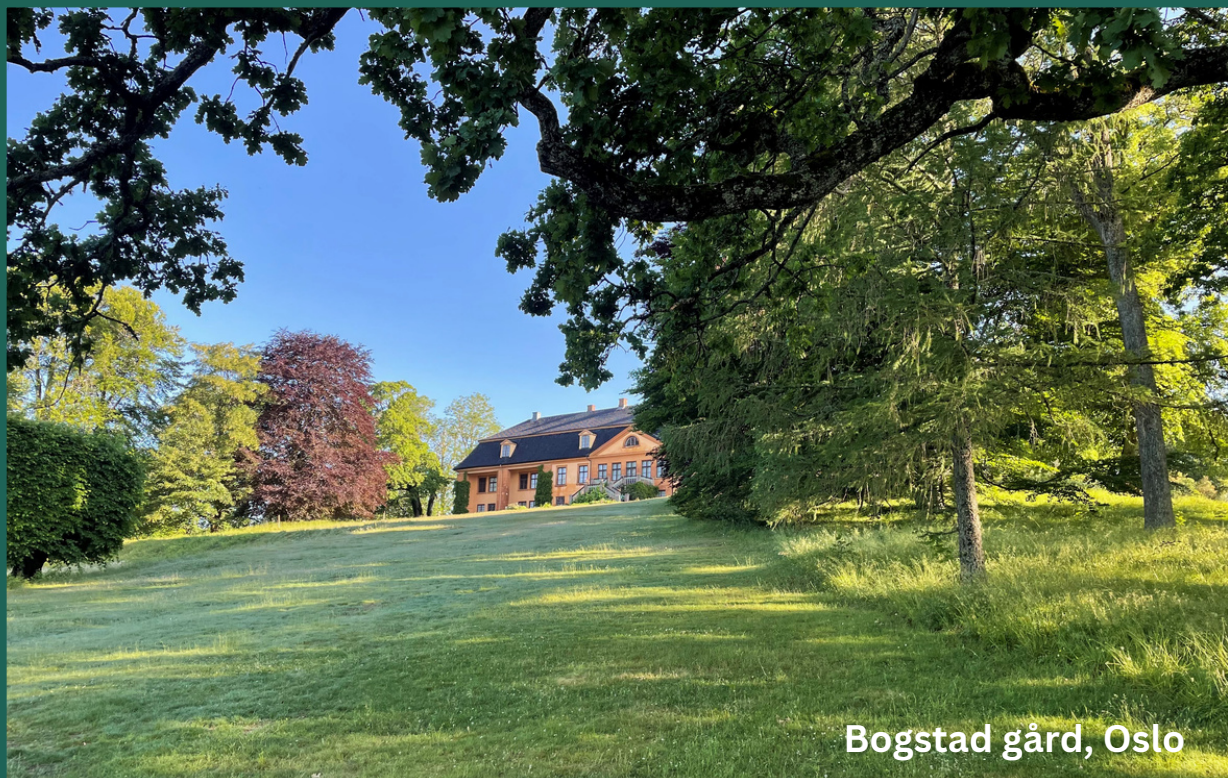
Bogstad gård, Oslo