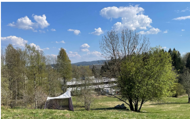
Bilde fra innsamlingen av insekter. Insektene samles i teltet som sees på bildet.

I tillegg gjennomføres en naturtypekartlegging med tilhørende skjøtselsråd av NINA i samarbeid med RKL, skjøtselsgruppen på Hestejordene, Bymiljøetaten og grunneieren Forsvarsbygg. Målet med kartleggingene er å bli kjent med hvilke arter som trives på hestejordene, og forbedre dagens skjøtsel av kulturlandskapet for å styrke det kulturbetingede naturmangfoldet ved Hestejordene.