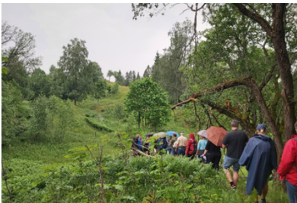
Gjenåpning av landskapet ved Kjelsaas gård