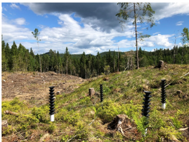
Barkbilleovervåkning i Lørenskog.

Statsforvalteren i Oslo og Viken sine nettsider .