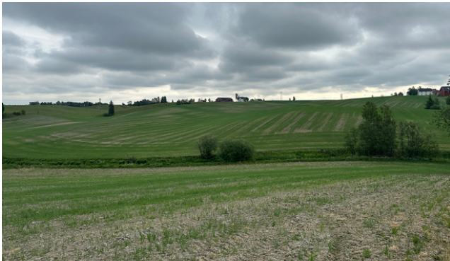
Kornåker påvirket av tørke.

Situasjonen med tørke og mulig avlingssvikt kan gi mange bekymringer, husk å be om hjelp og råd og ikke gå alene og bekymre deg. Kontakt en nabo, rådgivere fra landbruksrådgivingen, andre i næringen, eller oss ved landbrukskontoret for en prat.