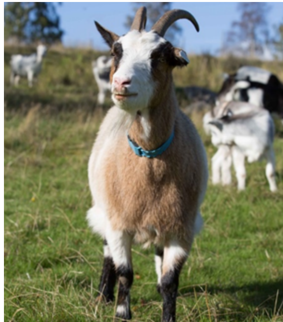
Kystgeit fra Bogstad Gård

Beitedyrene vil spille en avgjørende rolle i å opprettholde de karakteristiske trekkene i kulturlandskapet og bevare verdifullt naturmangfold.