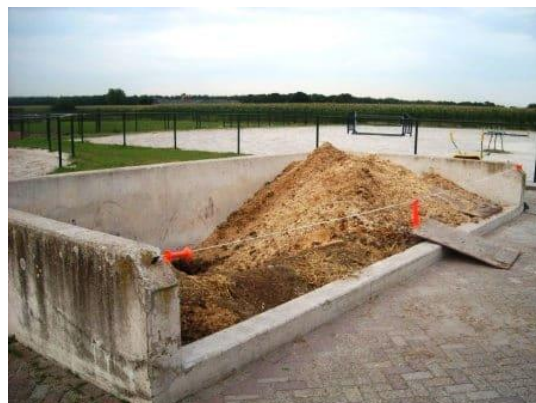
Figur 4: Lagerplass for hestemøkk