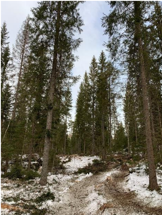
Figur 20: Lukket hogst ved Feiringseter i Lørenskog

Ved bruk av lukket hogst og ved drift av kontinuitetsskog, vil terrengtransport kunne bli en utfordring. I begge tilfeller må hogsten utføres flere ganger samme sted, noe man slipper ved flatehogst. Tiden og ressursene man bruker på terrengtransporten blir avgjørende for lønnsomheten.