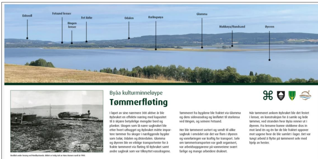
Figur 10: Infotavle ved Byåa kulturminneløype i Rælingen

Andre aktuelle tiltak kan være skilter, porter, klyvere, merking, infotavler og kompensasjon for vesentlig ulempe forbundet med allmenn ferdsel, for eksempel avlingstap.