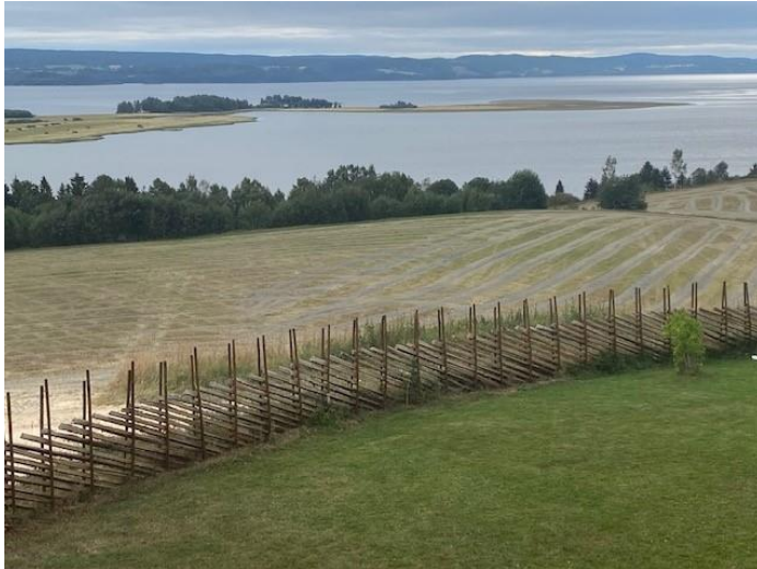
Figur 13: Systematisk drenert jorde i Rælingen