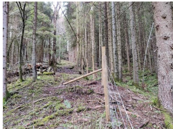
Figur 9: Inngjerdet beite med nettingjerde