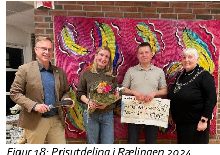
Figur 18: Prisutdeling i Rælingen 2024