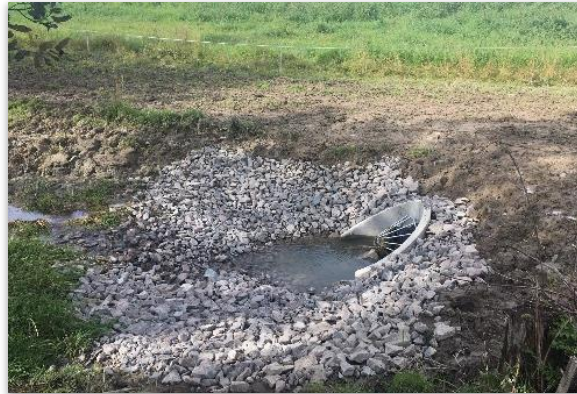
Figur 2: Erosjonssikring av utløp