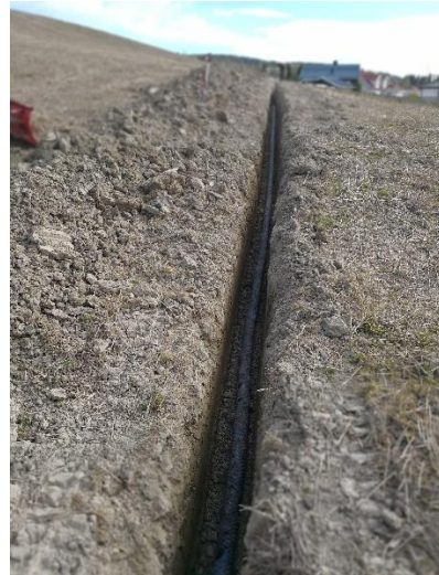
Figur 14: Drensrør