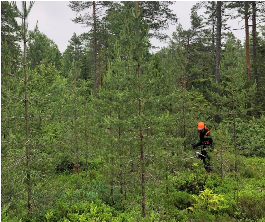
Figur 19 Ungskogpleie på et felt i Rælingen.

Det kan gis tilskudd til ungsogpleie. Den kan utføres som en ren avstandsregulering (reduksjon i treantallet), og/eller, fjerning av produksjonstrær med feil/skader og konkurrerende treslag.