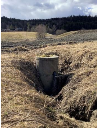
Figur 1: Erosjon rundt kum

men kan også legges i flomveier. Tilskudd kan gis hvis disse er kun plassert slik at de har positiv effekt på dyrka jord og bidrar til å redusere erosjon og avrenning til/fra jordbruksarealer.