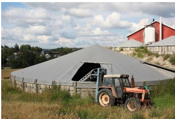
Figur 3: Dekke over gjødselkum