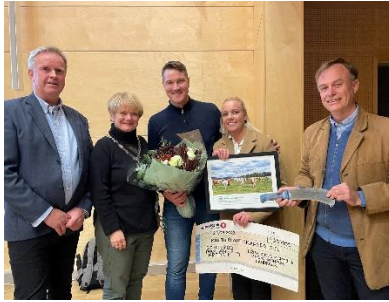
Figur 16: Prisutdeling i Lørenskog 2022