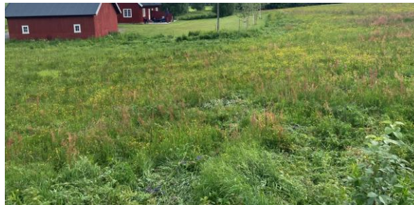
Figur 7: Samme areal etter bekjempelsen