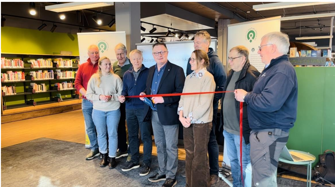
Figur 15: Åpning av fotoutstilling fra UKL Sørkedalen og Nordmarksplasser, på Deichmann Røa

UKL-ordningen er et spleiselag mellom Landbruksdirektoratet, Miljødirektoratet og Riksantikvaren. Ordningen har vært forvaltet av Statsforvalteren frem til 2019, da den ble delegert til kommunene. Kommunen får ikke øremerkede statlige midler til å administrere UKL-ordningen. Men, Oslo kommune setter av hvert år i sitt budsjett et beløp for at denne ordningen blir forvaltet av landbrukskontoret. UKL-tilskudd kan gis til grunneier og andre organisasjoner som bidrar til å nå målene i forvaltningsplanen for UKL-Nordmarksplasser og UKL-Sørkedalen i Oslo kommune.