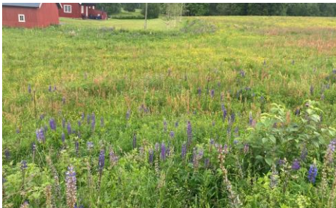
Figur 6: Areal med lupiner i Sørkedalen

Det kan gis tilskudd til tiltak som begrenser eller forhindrer spredning og etablering av fremmede arter. Flere fremmede arter kan være svært invaderende, og kan ha stort potensiale for å påvirke stedegne arter og biomangfoldet i kulturlandskapet. Eksempler på tiltak kan være rådgiving eller utarbeidelse av plan for bekjempelse av fremmede arter på eiendommen ifølge fremmedartslisten , slått eller lusing av kjempespringfrø, kanadagullris, hagelupin eller andre arter som har stort skadepotensial. Langsiktige planer som viser til kontinuerlig bekjempelse av fremmede høyrisikoarter skal prioriteres.