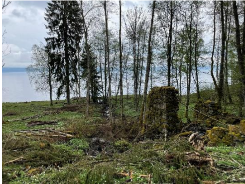
Figur 11: Vegetasjonsrydding rundt sagmurrester ved Byåa i Rælingen.