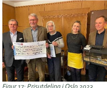
Figur 17: Prisutdeling i Oslo 2023