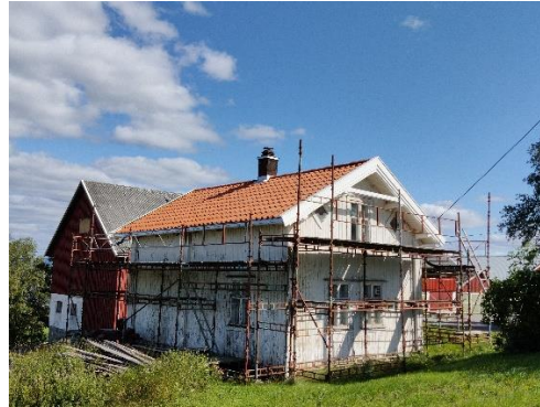
Figur 12: Nytt tak på gammel bygning ved Nes gård i Rælingen.