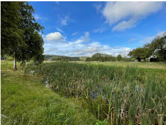
Figur 5: Gårdsdam på Nordre Våler i Lørenskog

Raviner er en sårbar naturtype tilknyttet jordbrukslandskapet. Både raviner med et naturlig skogbilde, og raviner som brukes til beite, har et stort biologisk mangfold, uavhengig av størrelsen. På kulturbeiter finnes ofte en rik flora av karplanter og i blomsterrike sørvendte ravinesider trives mange pollinerende insekter.