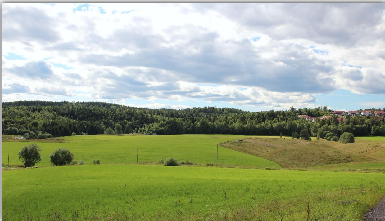
Foto 10: Beiteområder ved Hauger med bebyggelsen på Vallerud i bakgrunnen, Ana Nilsen