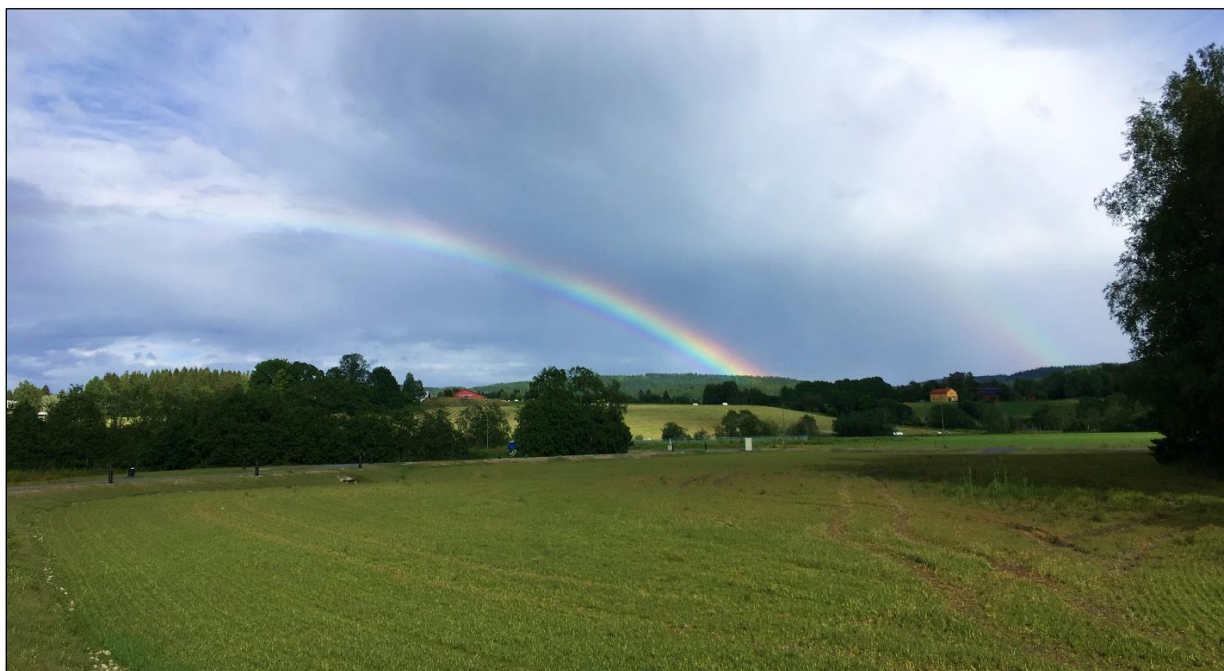
Foto 3: Elveparken ved Torshov med jordbruksarealer på Hammer i bakgrunn, Ana Nilsen