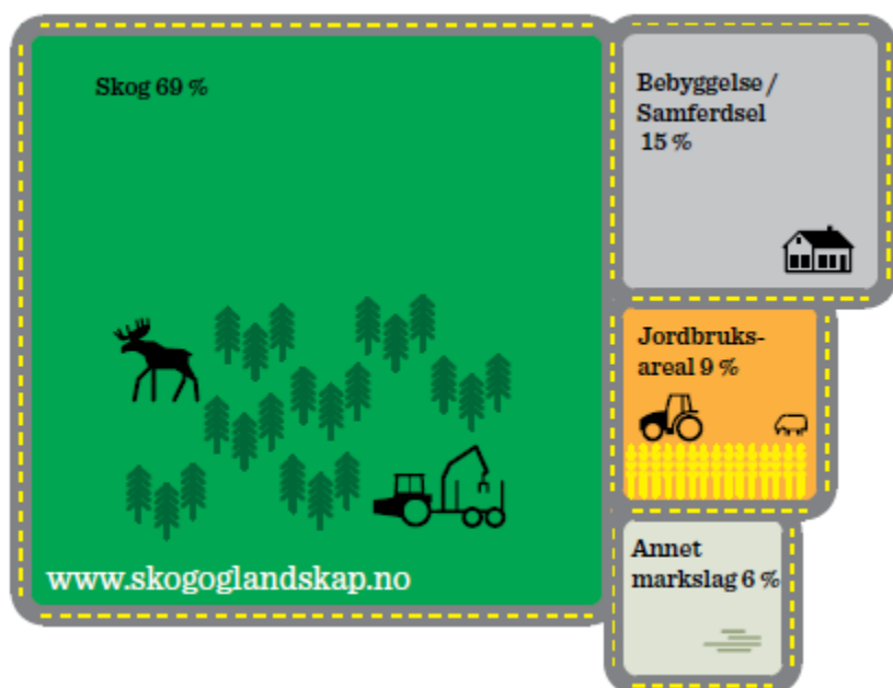
Fig 1: Markslagsfordeling i Lørenskog

I Lørenskog er det åpnet for jakt etter elg, rådyr og bever, i tillegg til annen småviltjakt. Jakt som friluftslivsaktivitet er for mange viktig. I kommunen er det av store rovdyr, både gaupe og ulv. Lørenskog kommune ligger innenfor ulvesone 4 og ulven har etablert et revir i Østmarka. Fiske er en annen form for fangst og friluftsliv som er viktig.