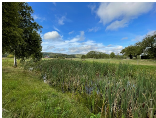
Gårdsdam på nedre Våler gård i Lørenskog

Det kan få store økonomiske konsekvenser for deg som gårdbruker om gjødslingsplanen ikke er i tråd med kravene i forskrift om gjødslingsplanlegging. Normen er at 20 % av areal- og kulturlandskapstilskuddet avkortes når planen mangler. For RMP er det enda strengere, hvor inntil 100 % av tilskuddet kan avkortes hvis gjødslingsplan mangler.