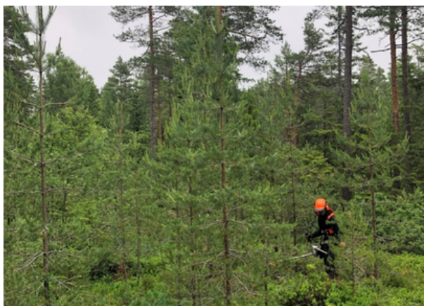
Ungskogpleie på et felt i Rælingen

Ny skogbruksplan kan finansieres med skogfond. Det gis i tillegg inntil 40 % tilskudd fra staten. For skogeierdommer over 50 dekar produktivt skogareal kreves det registrering av nøkkelbiotoper (MiS-figurer). Nøkkelbiotoper skal dokumenteres i skogbruksplan eller miljøoversikt. Der skjøtselstiltak kan gjennomføres, skal det være beskrevet i skogbruksplanen eller miljøoversikten. Å ha en skogbruksplan med miljøregistreringer er med andre ord et krav for omsetting av tømmer.