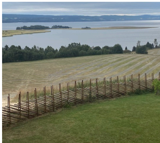
Dreneringssystem på et jorde i Rælingen

UKL-rammen for 2025 er 975 000 kr, for de to UKL-områdene i Oslo. Tilskuddet skal søkes elektronisk via altinn . I veilederen for UKL- Oslo 2025 kan du lese om prioriterte tiltak, veiledende satser og saksbehandlingsrutiner. Søknadsfrist 15. mars.