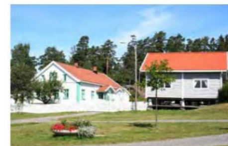
DAGENS SITUASJON SKÅRER GÅRD Skårer er et historisk bygningsmiljø som tilfører tidsdybde til området.

Skårer gård er opprinnelig fra sen vikingtid. Låven har gjennomgått mange forandringer siden den eldste delen ble oppført på slutten av 1700-tallet. Den eldste delen av våningshuset er fra samme periode. Stabburet er fra 1860. Gårdsdriften opphørte på slutten av 1960-tallet.