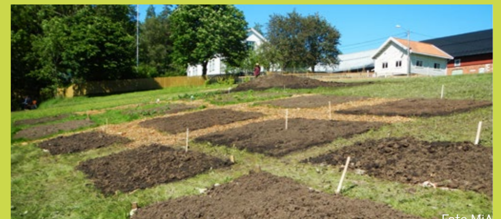
Skolenes parseller 2019