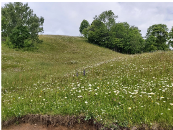
Slåttemark ved Kjelsaas gård, UKL-Sørkedalen.

UKL-rammen for 2023 er 1 050 000 kr, for de to UKL-områdene i Oslo. Tilskuddet skal søkes elektronisk via Altinn . Søknadsfristen er 15. mars. I veilederen for UKL-Oslo 2023 kan du lese om prioriterte tiltak, nye veiledende satser og saksbehandlingsrutiner. Ta kontakt med oss hvis du trenger hjelp til å sende inn en søknad.