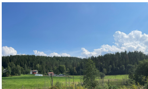
Bjørndalen sett fra Mariholtveien. Arealet beites av storfe.

Bjørndalen har en rik landbrukshistorie og nær tilknytning til Ellingsrudelva hvor det har eksistert møller, teglsteinsverk, kistedammer, badeplasser og beiteområder i lang tid. Prosjektgruppen ønsker i tillegg å restaurere et tidligere beite i dalen som per i dag gror igjen.