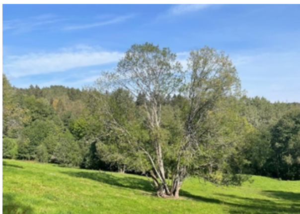
Beiteareal på tilhørende hestejordene. Foto: Ana Nilsen (2021)

Som en del av prosjektet skal vi se på mulighetene for å forbedre skjøtsel av beitenene, forme styvingstrær og øke tilretteleggingen av eksisterende friluftslivtilbud ved Hestejordene.