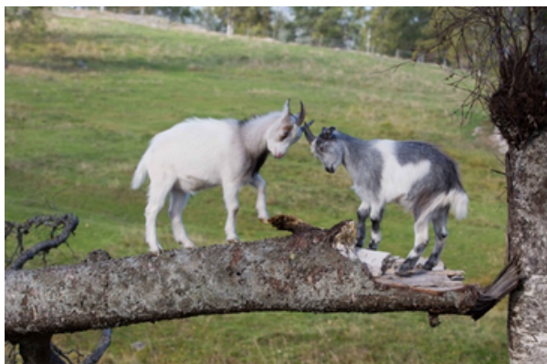
Kystgeit fra Bogstad Gård