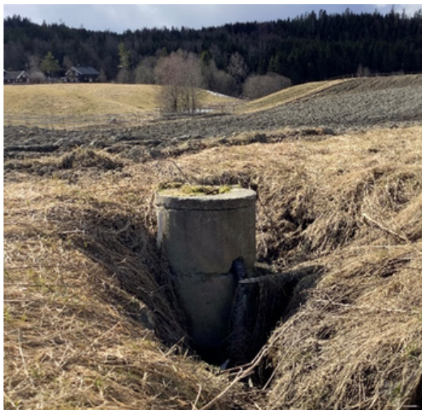
Erosjon rundt kum, et problem på jordbruksareal som kan repareres med SMIL-tilskudd

Satsene for dreneringstilskudd har også økt fra 2000 til 2500 kr/daa systematisk grøfting.