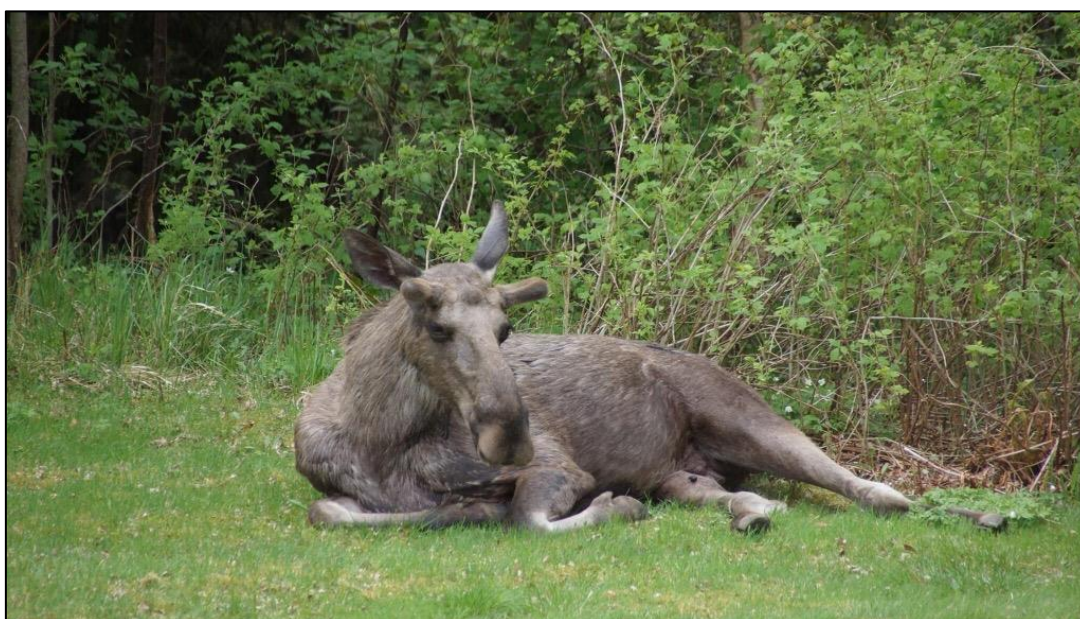
Bilde 1 Elg; Foto: Øyvind Herland

Elgen er en kilde til naturopplevelser og er en ressurs for jegere og rettighetshavere. Minste areal for å jakte etter elg er 3000 daa jf. forskrift om jakt etter elg, rådyr og hjort i Lørenskog. Elgjakten i Lørenskog er organisert gjennom Losby elgvald, og den foregår på total 56 089 daa. Losby - Lørenskog forvaltningsområde er tilsluttet Østmarka elgregion sammen med flere andre elgvald i nabokommunene.