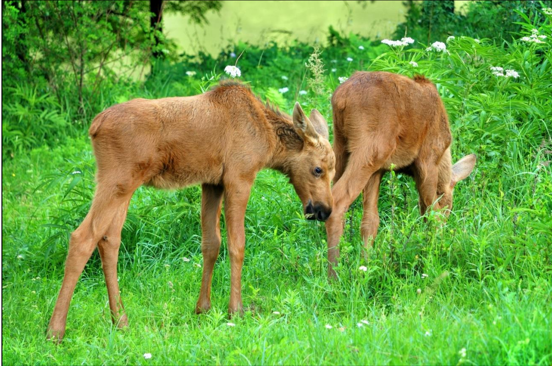
Bilde 2 Elgkalver; Kilde: Colourbox.com

Utviklingen i slaktevekter for kalv og ungdyr (1,5 åring) viser forholdsvis stabile vekter, med en svak negativ trend for ungdyr de siste årene. Kalvevektene har lenge vært på over 60 kg, men viser en svak negativ tendens de siste årene.