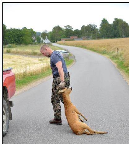
Bilde 6: Håndtering av påkjørt rådyr