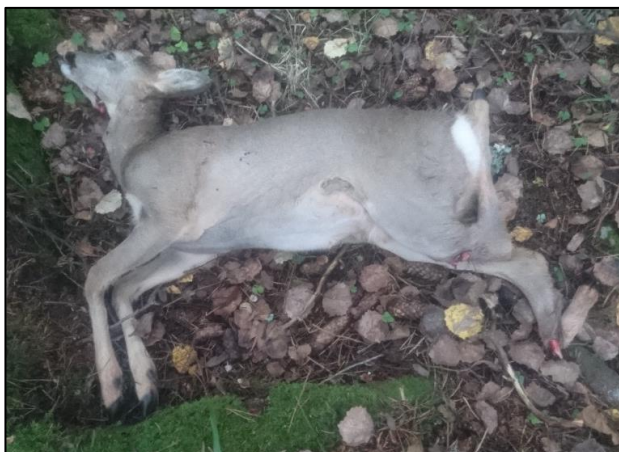
Bilde 5: Påkjørt rådyr; Foto: Øyvind Herland

Hjortevilt som blir skadd eller dør av andre årsaker enn ordinær jakt går under samlebetegnelsen fallvilt. Lørenskog kommune har en egen vilttoppsynsgruppe som håndterer fallvilt og gjør tilsyn i Marka. Vilttoppsynet er bemannet med tre personer og ettersøkshunder. De er på vakt døgnet rundt og rykker ut ved henvendelser om hjortevilt. Risikoen for å møte elg på vei i Lørenskog vurderes å være ganske lav. Det har blitt registrert kun 1 elgpåkjørsel i de siste 5 årene i Lørenskog. I motsetning til elg, er antallet trafikkdrepte rådyr høyt. I gjennomsnitt har det blitt påkjørt mellom 13-25 rådyr per år i de siste 3 årene og antallet ligger på 22 % av jaktuttaket. Kommunen ønsker å redusere antallet trafikkdrepte rådyr til inntil 9 påkjørsler per år, eller 10 % av jaktuttaket.