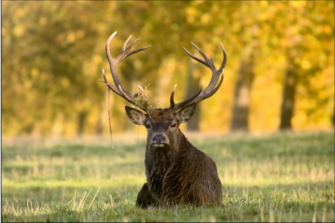
Bilde 4 Hjort