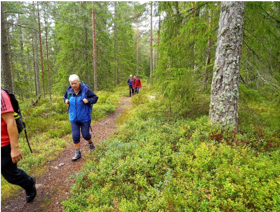
På blåmerket sti over Svarvestolsbrenna. Ikke så lett å se at dette er en gammel driftsvei.

Den planlagte driftsveien vil utgjøre et stort inngrep i terrenget. Den vil ha påvirkning på natur og bryte opp dagens skogbilde for de som er på tur i terrenget. I forbindelse med vurdering av tillatelse til bygging av driftsveien mener vi at en må undersøke nærmere om det er mulig å legge traseen slik at den er mindre til sjenanse for ferdsel i området. Vi mener også at en bør utrede bedre hvilke natur- og kulturverdier som er i området, slik at dette kommer bedre frem i søknaden og en kan fatte beslutning på et bedre grunnlag.